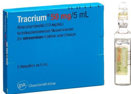
Tracrium amp atracurium 50mg=5mL (10mg/mL) (1 x 5) article 4479

En raison du contexte COVID-19, ces différents médicaments peuvent être en circulation simultanément. Tous sont à stocker au frigo.