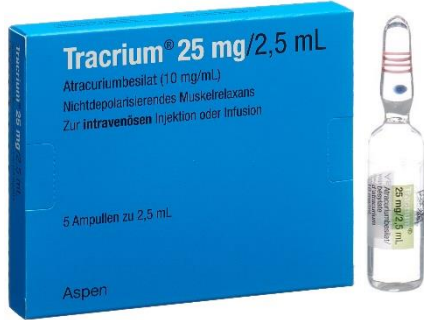
Tracrium amp atracurium 25mg=2.5mL (10mg/mL) (1 x 5) article 447704