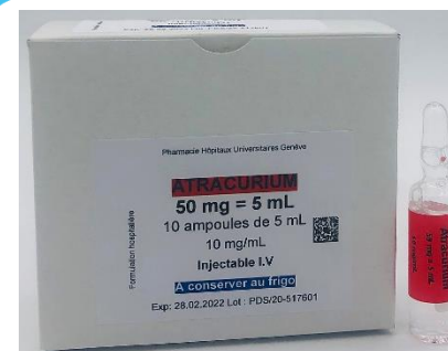
Atracurium HUG amp atracurium 50mg=5mL (10mg/mL) (1 x 10) article 481027