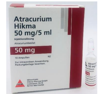
Atracurium amp atracurium 50mg=5mL (10mg/mL) (1 x 10) article 480942