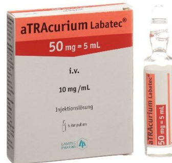
Atracurium amp atracurium 50mg=5mL (10mg/mL) (1 x 5) article 437105