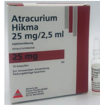
Atracurium amp atracurium 25mg=2.5mL (10mg/mL) (1 x 10) article 480943

En raison du contexte COVID-19, ces différents médicaments peuvent être en circulation simultanément. Tous sont à stocker au frigo.