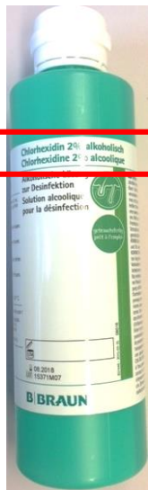
250mL Code article 423577

Chlorhexidine® sol alcoolique incolore 2% chlorhexidine