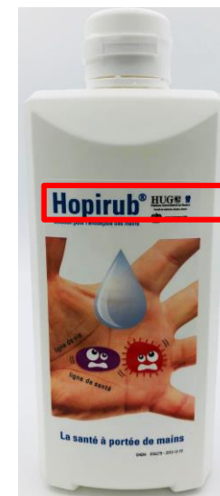
Hopirub® isopropanol, chlorhexidine 500mL Code article 142858

Rappel : pour pallier à la rupture de Chlorhexidine sol. alcoolique 2% 250mL , des flacons de Chlorhexidine sol. alcoolique 2% 500mL ont dû être pris en stock.