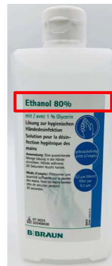
Solution hydro-alcoolique éthanol 80% 500mL Code article 484284