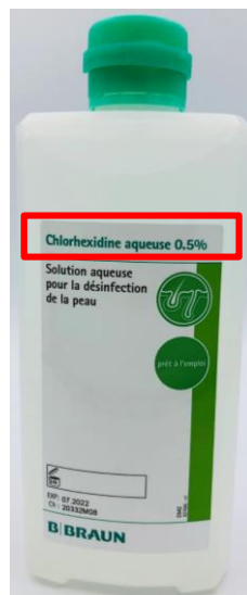
Chlorhexidine® sol aqueuse 0.5% chlorhexidine 500mL Code article 423575

! Ne pas confondre les flacons à 500mL !