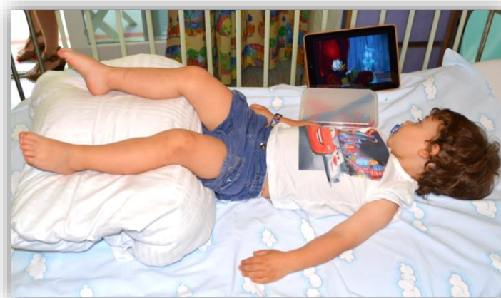
Extravasation au pied