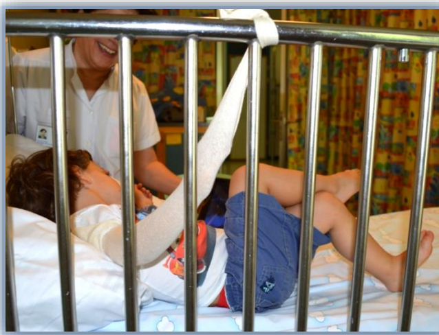
Extravasation au bras