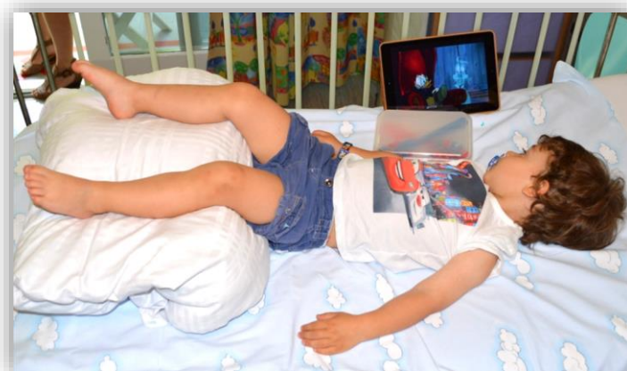
Extravasation au pied