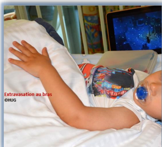
Extravasation au bras