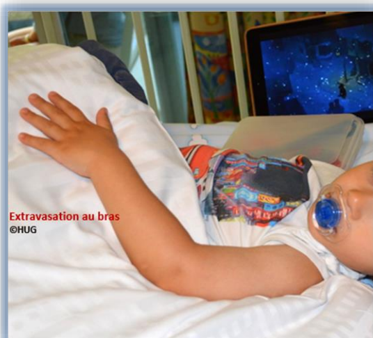
Extravasation au bras